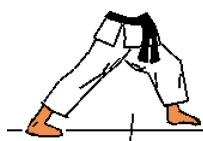
Técnicas com deslocação na posição de Zenkutsu Dachi

Andamento com pontapé frontal executado com a perna da frente seguido de pontapé semi circular executado com a perna de trás