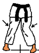
Técnicas com deslocação na posição de Sanchin Dachi